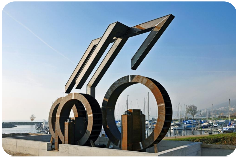
Saint-Blaise, Fontaine du Millénaire Architecte Mario Botta