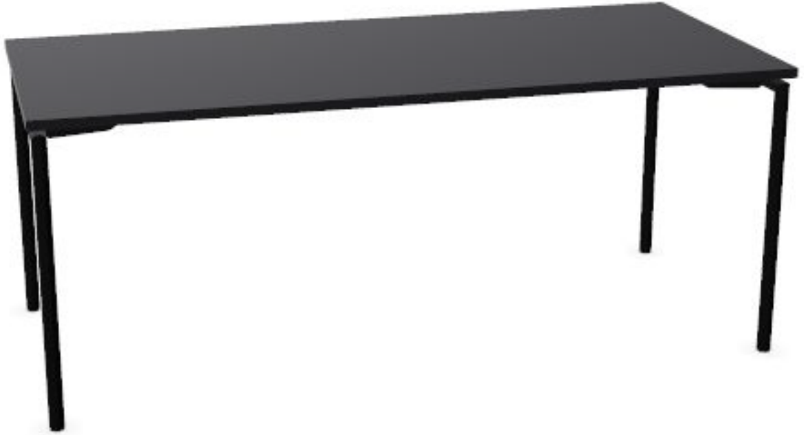
Table Casala, modèle Lacrosse II

Table à piétement pliable. Plateau léger avec un cœur en particule de bois d'Albasia de haute qualité recouverte de 2 couches de stratifié HPL 21mm avec chant ABS 2mm d'épaisseur couleur similaire que le plateau. Piétement en tube d'acier chromé 35 mm de diamètre. Épaisseur de la paroi du tube 2mm. Patins en plastique réglables. Châssis composé de rail de renfort en aluminium extrudé laqué noir qui garantissent un maintien droit du plateau. Mécanisme d'ouverture accessible sur toute la largeur de la table, ultra-fonctionnel et anti pincement des doigts breveté, sécurité empêchant une fermeture accidentelle.