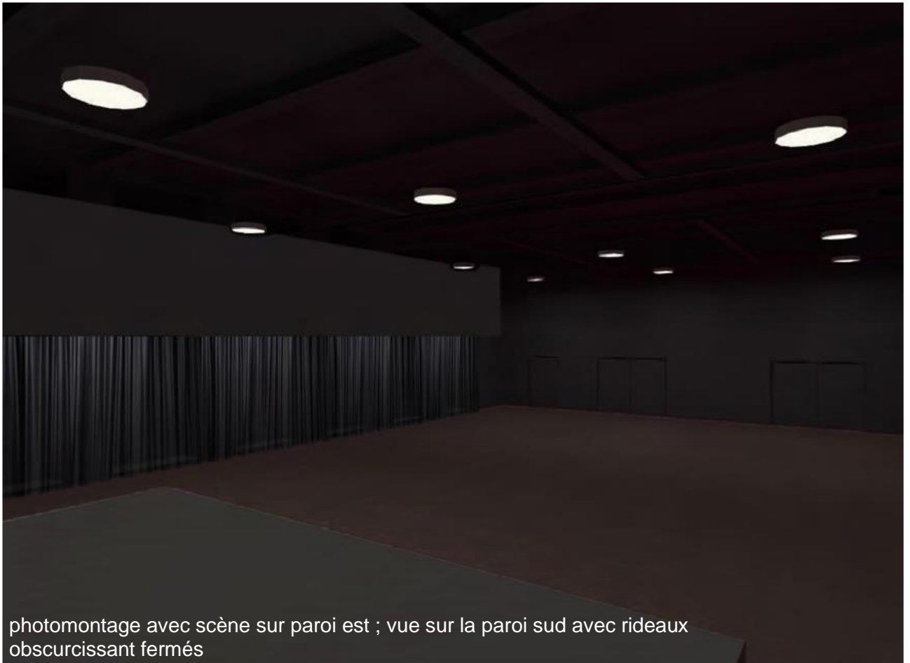
photomontage avec scène sur paroi est ; vue sur la paroi sud avec rideaux obscurcissant fermés