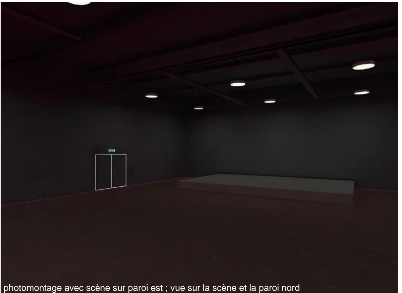
photomontage avec scène sur paroi est ; vue sur la scène et la paroi nord