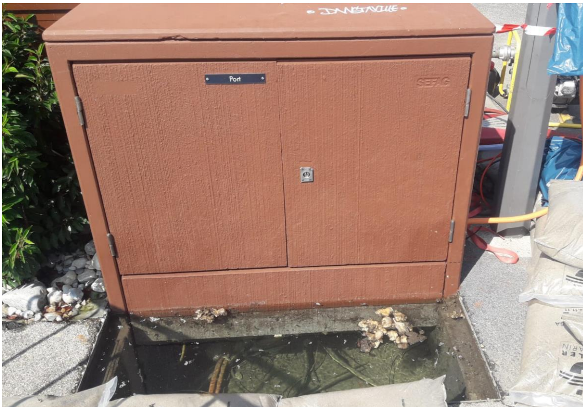
Figure 1 et 2 : Armoires de distribution réseau (chambre inondée)

Les armoires sont visibles dans les figures 1 et 2. Le nouvel emplacement proposé à la figure 3.